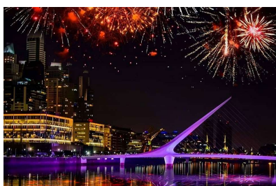
Buenos Aires fin de año